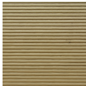
Asteiche Echtholz furnier