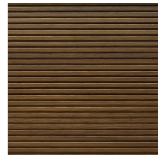
Kernnussbaum Echtholz furnier