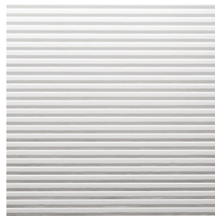
Weiss Alpi Furnier